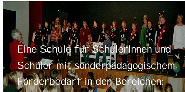
Eine Schule für Schülerinnen und Schüler mit sonderpädagogischem Förderbedarf in den Bereichen: