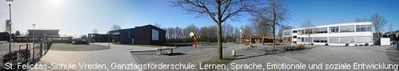
St. Felicitas-Schule Vreden, Ganztagsförderschule: Lernen, Sprache, Emotionale und soziale Entwicklung