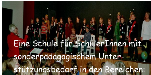
Eine Schule für SchülerInnen mit sonderpädagogischem Unterstützungsbedarf in den Bereichen: