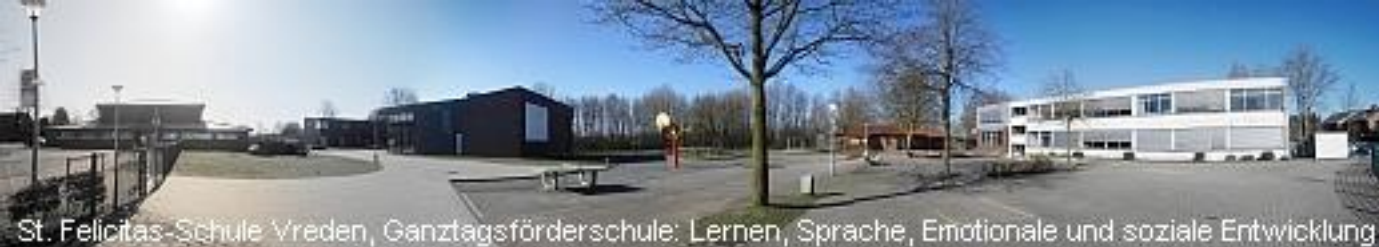
St. Felicitas-Schule Vreden, Ganztagsförderschule: Lernen, Sprache, Emotionale und soziale Entwicklung